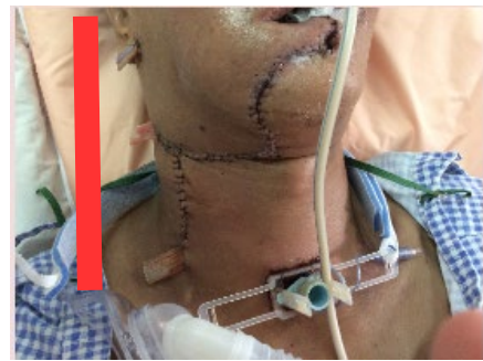
圖二、頭頸部保持一直線