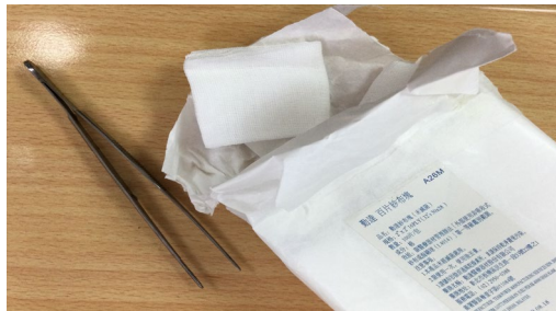
圖三、鑷子及口含紗