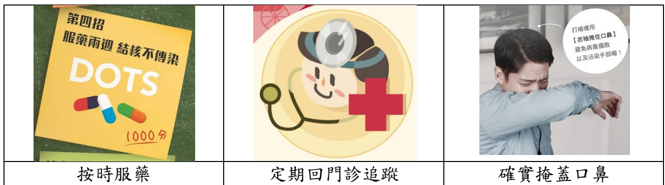
圖五居家照顧注意事項