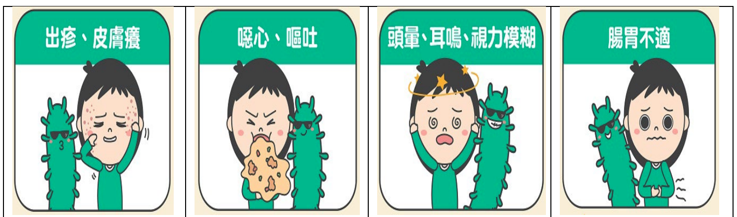
圖四結核藥物副作用