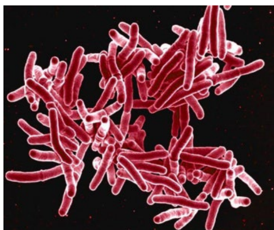
圖一結核分枝桿菌在電子顯微鏡掃描下形狀

結核病是由結核分枝桿菌(圖一)所引起。結核分枝桿菌是一種喜歡在有氧氣環境中生活的抗酸性細菌，除了人體肺部外(圖二)，腦膜、淋巴腺、骨骼、腸、生殖器等任何器官或組織都可能會被侵害，其中以侵害肺部最多見。只要早期診斷及規則服藥，治癒率幾乎可達100%。